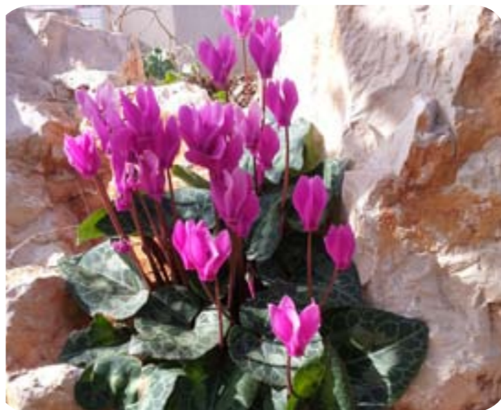
פריחה בכל פינה...